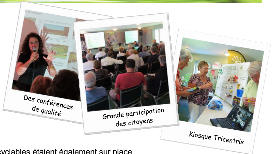
Des conférences de qualité

Des kiosques d'information sur les matières recyclables étaient également sur place.