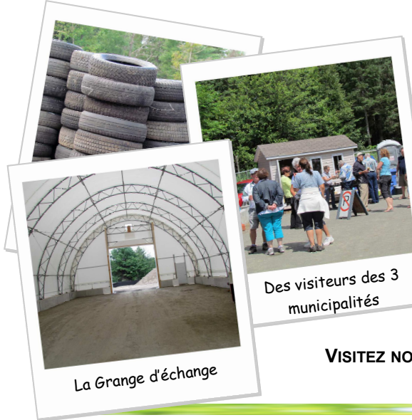
Des visiteurs des 3 municipalités